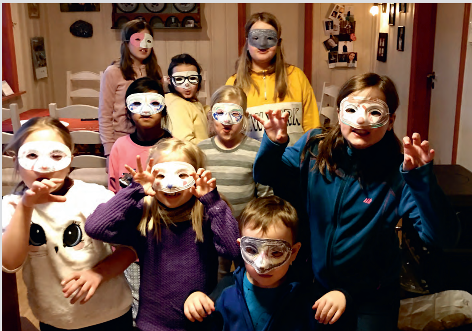
Barna er klar for refleksorientering.