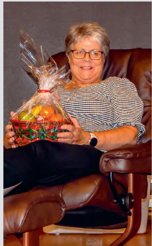
Julemessegeneralen slapper av. Lederen i Vestborglaget har tatt seg en pause med og i gevinstene.