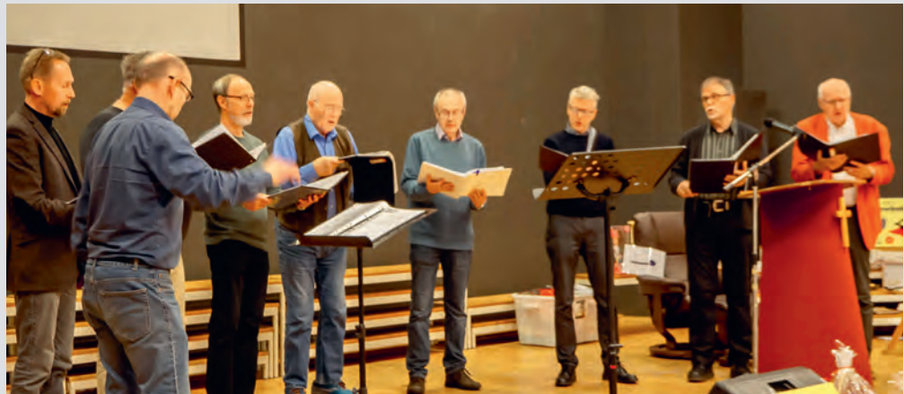
Kor Herrleg har medlemmer fra Haram, Skodje og Stordal og over på bedehuset på Vatne.

I år laga dei 48 kranssekaker i tillegg til