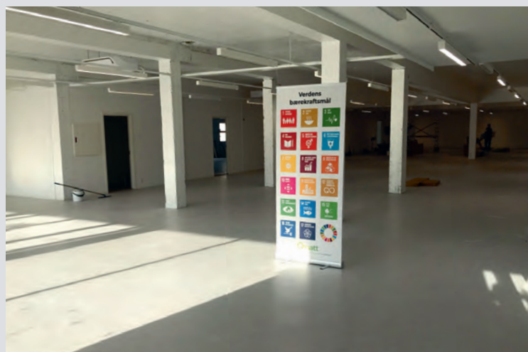
Her ser vi korleis dei nye butikklokala har blitt.

KAFÉ OG ULIKE AKTIVITETAR. Andre etasje skal gi rom for ulike aktivitetar. Planlegginga og utforminga av dette er i startfasen, og styret er i nær dialog med Gjenbruken og forsamlinga i denne prosessen. Lokalet kan gi rom for ulike dia-