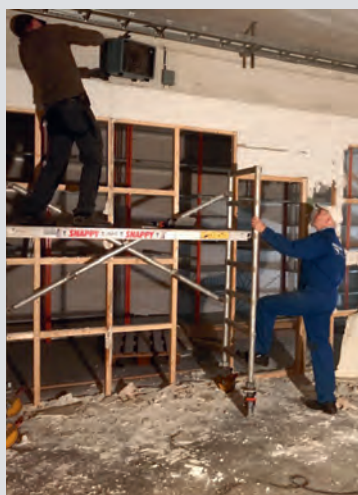
Slik gjekk det føre seg i den fyrste fasen av dugnadsarbeidet.

Denne etasjen inneheld eit lyst og stort butikklokale, to store lagerrom for inntak og klargjering av varer, toalett og personalrom. Utforminga av butikklokalet er gjort i nært samarbeid med Gjenbruken sentralt.