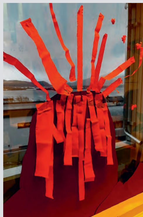
Vi leste om vulkaner og laget vår egen vulkan.