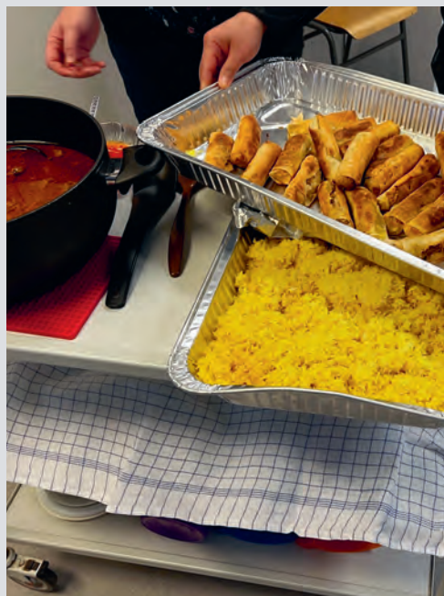
Alle fikk smake på ekte indonesisk mat og vi synes det var godt.

TUREN HAR STARTET. Før vi fikk gå om bord ble vi «testet», pass og billetter var i orden hos