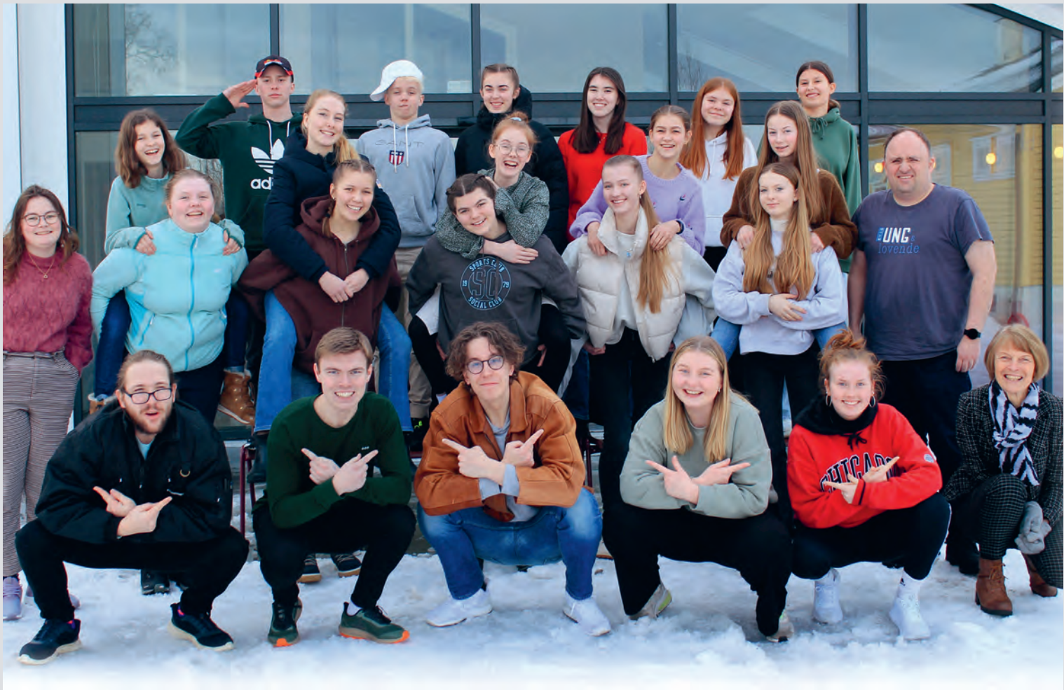
Kairos samlet på Vestheim ungdomssenter.