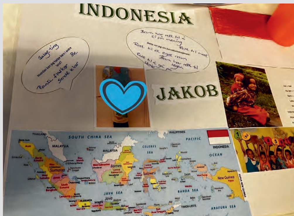
Vellykket tur krever god planlegging og forberedelse.