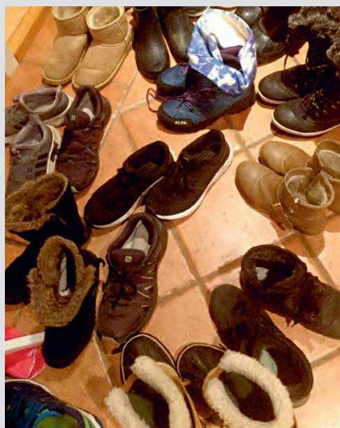
Gangen i huset blir fylt opp av sko når ungdommene kommer på bibelgruppe.

Vi håper bibelgruppa er til velsignelse for de – etter hvert ganske mange – som har deltatt i den. Vi som får stille vår lille stue til disposisjon, er i hvert fall velsignet. Ekstra moro