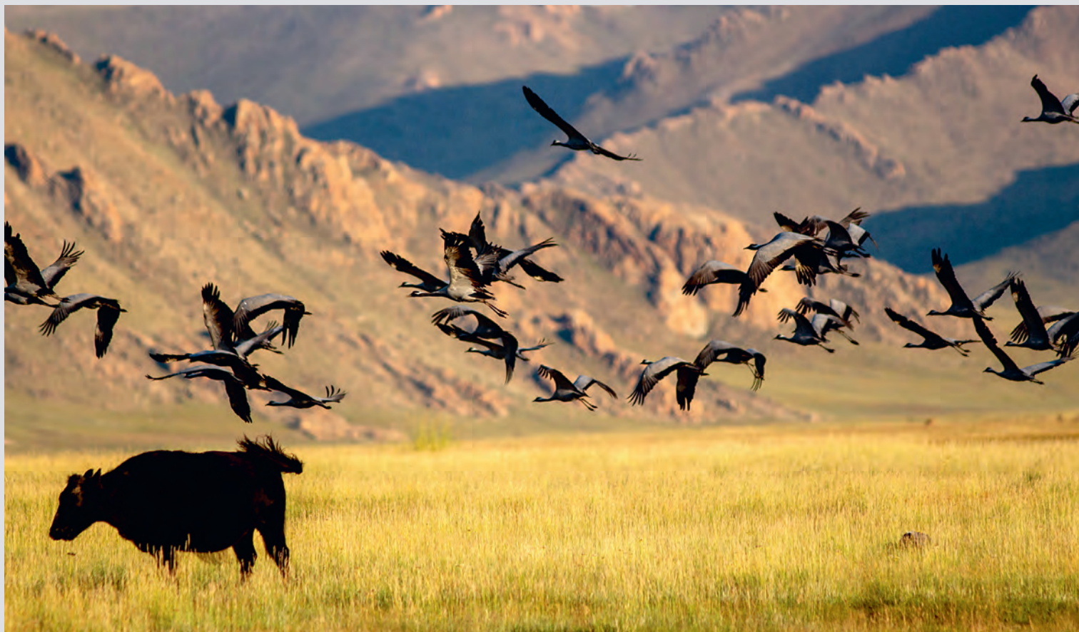
Landskap i Mongolia.