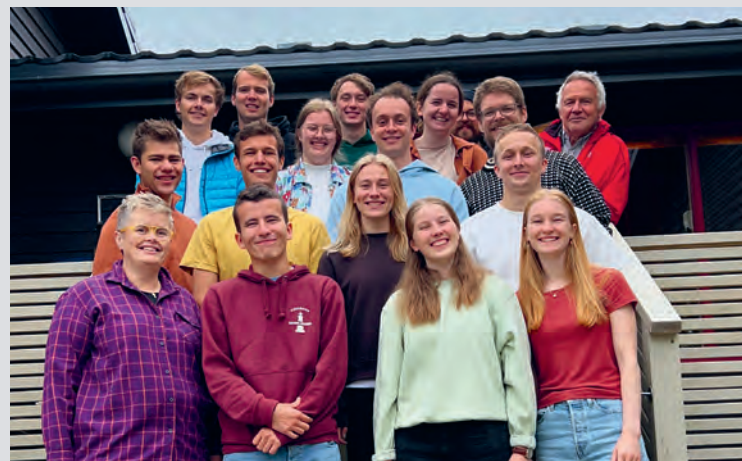
Deltakerne på den første VITNE i Finnmark- leiren.

For mange av deltakerne var det året på Fjellheim bibelskole som satte det hele i gang, men det var like fullt en betydelig spredning i bakgrunn blant de påmeldte. Naturen bredte seg ut i all sin storslåtte prakt og skodda stilte trofast opp på Nordkapp.