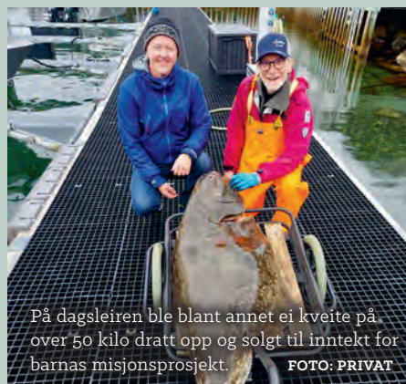
På dagsleiren ble blant annet ei kveite på over 50 kilo dratt opp og solgt til inntekt for barnas misjonsprosjekt.

– Jeg liker best å drive med sang og musikk, andakt, relasjonsbygging og organisering, og vil si vi er et team som utfyller hverandre ypperlig.