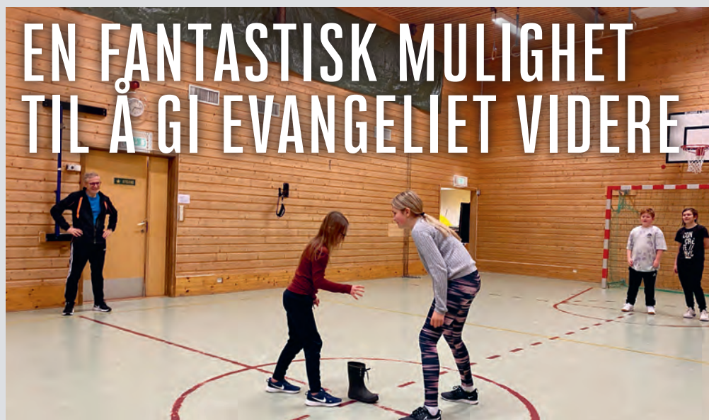
Nesten alle ungdommene i Kårvikhamn deltar på allidretten.