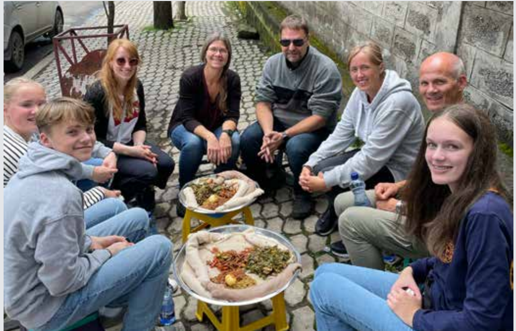
Lokal mat falt i smak! Her på restaurantens nokså enkle interiør.