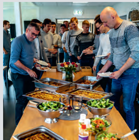
Aktiviteter og mat var av ypperste klasse på Skoghus.

Selv om årets mannshelg på Skoghus hadde deltakere fra både Meløy, Bodø og Oslo var det de finske gjestene som hadde reist lengst.