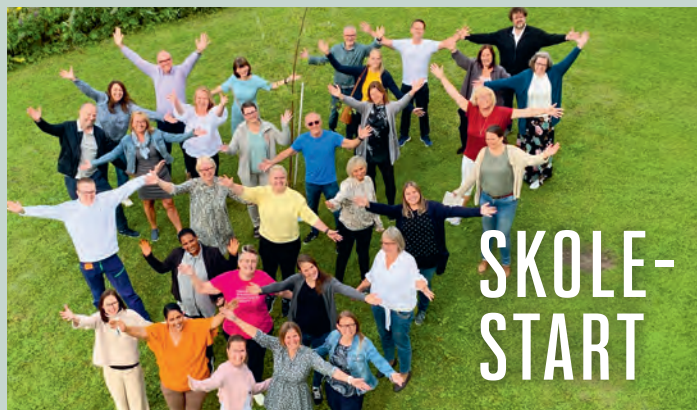
De ansatte på vgs, klare for et nytt år med elever!

FORVALTNING. Styret for Jakobsbakken har også de siste årene arbeidet med forvaltningen av eiendommene videre, og skisser av dette ble presentert. Regionstyret har i skrivende stund dette til behandling og håper og ber om gode prosesser videre.