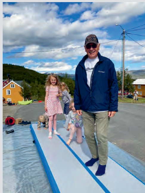
Været ble bedre utover i uka og ga muligheter for mange uteaktiviteter.