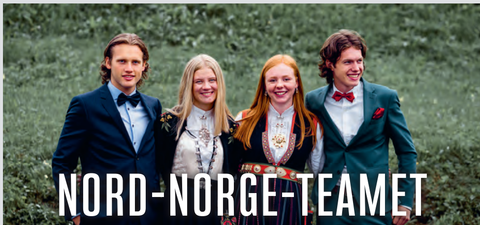
Fire nye teammedlemmer er klar for et spennende år!