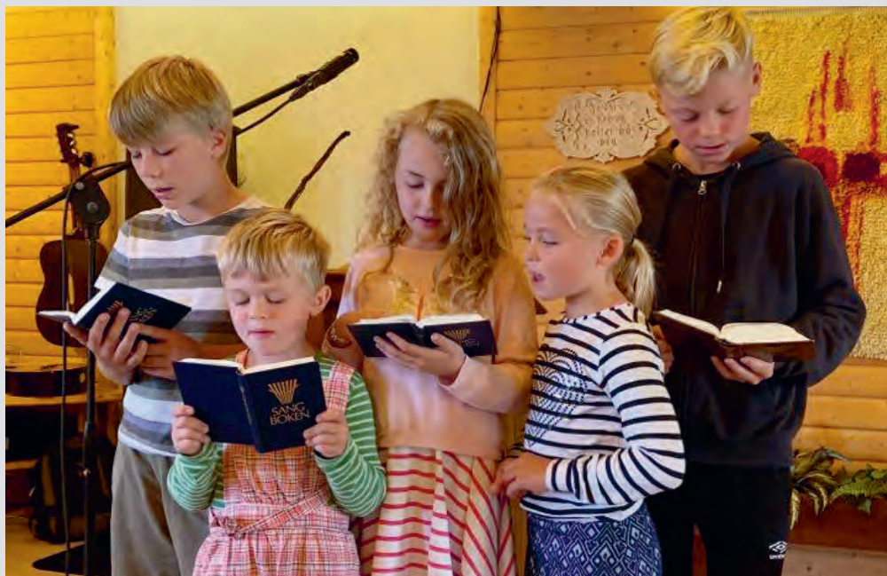
Noen av barna deltok med sang på flere av samlingene.