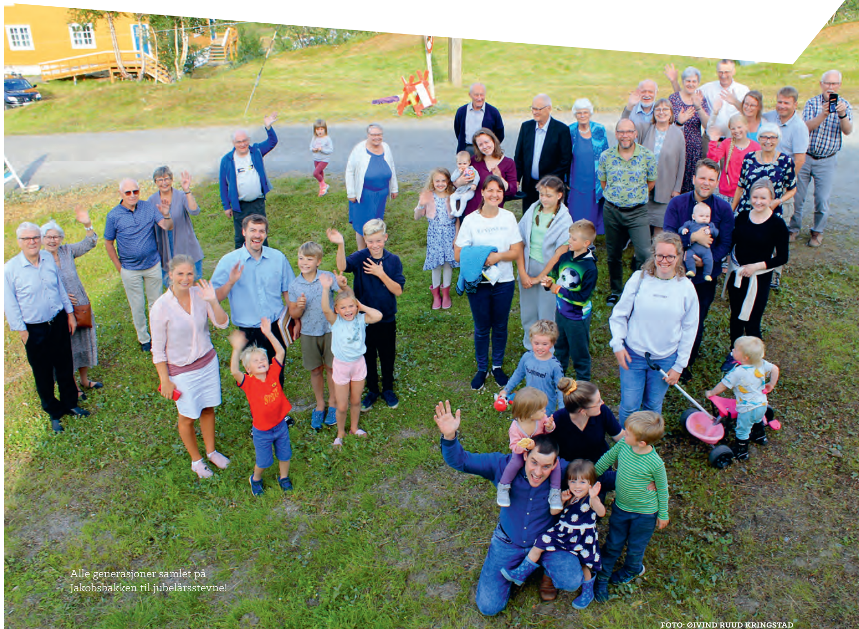
Alle generasjoner samlet på Jakobsbakken til jubelårsstevne!