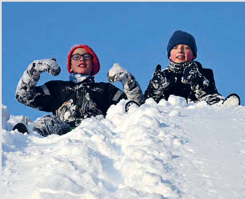
Tweens Aure hadde i februar en dagsleir på Søvassli.