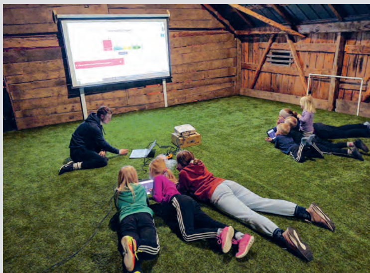
Barnelaget Blåveisen i Innset har samlinger i en låve med kunstgress på gulvet.