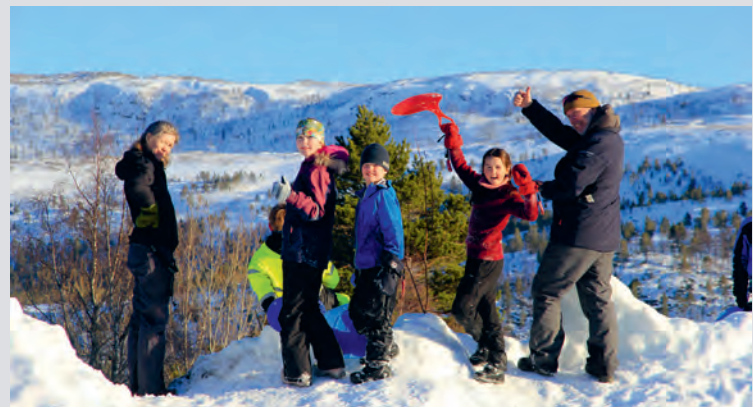
Det ble en flott dagsleir for Gnisten på Søvassli.

Bålkos og grilling hører med, og etter at magene igjen var met-