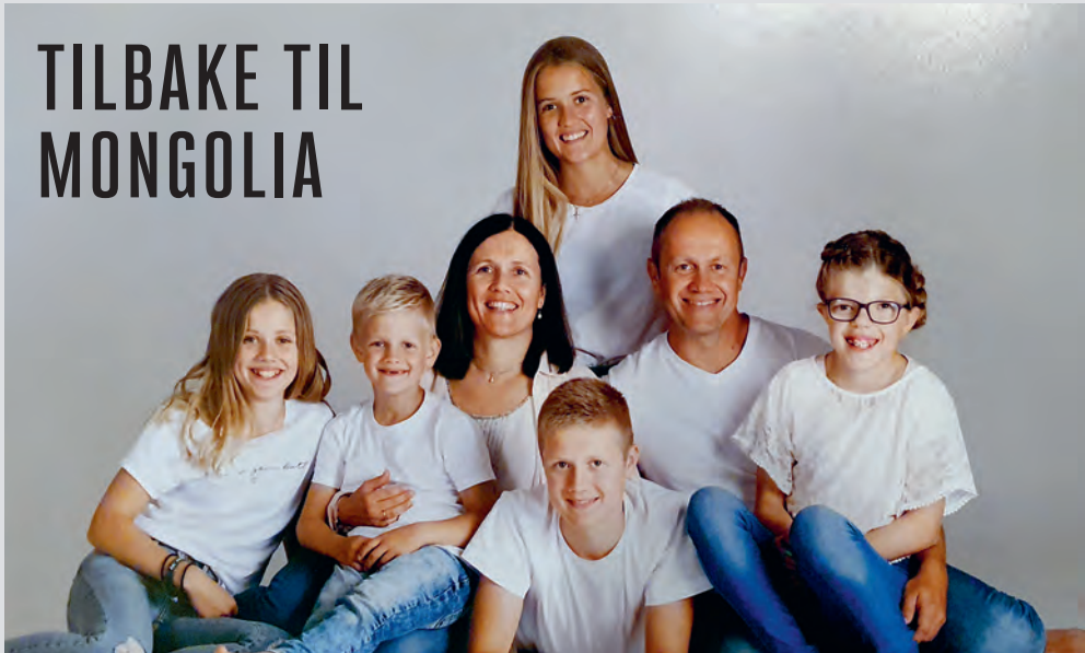
Fem av sju medlemmer i familien Jonasmo reiser til Mongolia.