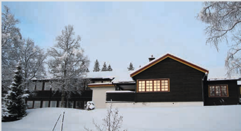
Søvassli ungdomssenter er ett av flere steder Region Midt-Norge som arrangerer leirer.

Det medfører ingen forpliktelser å være medlem. Medlemskapet koster kr 100 per kalenderår, og gjelder for barn til og med 14 år. Medlemskapet gir kr 100 i rabatt på hver av leirene medlemmet deltar på det året. Dette gir et reelt prisavslag fra leir nummer to