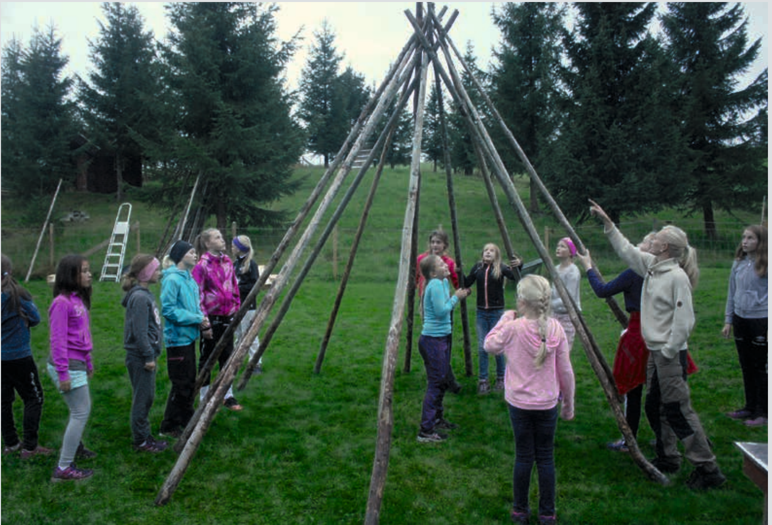
Mange av aktivitetene i yngreslaget Gnisten på Flå foregår utendørs. Da tenner de alltid bål, og tilbereder mat på bålet. Her bygges lavvo.