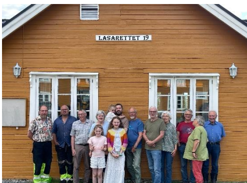
Avduking av navneskilt på matsalen.

for stedet løper frem til 2063 og styret har nedsatt en arbeidsgruppe som skal se på misjonens vilkår for bruk av stedet i årene som kommer.