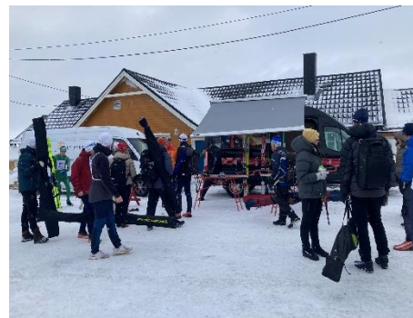
Kobberløpshelg på Jakobsbakken