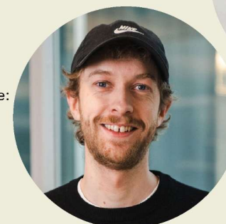
THOMAS NETELAND