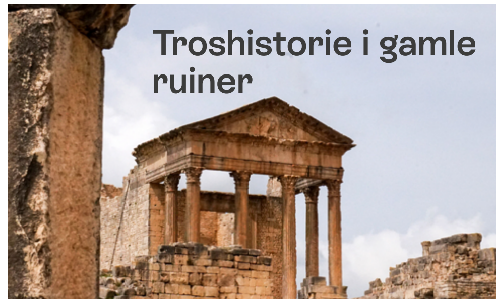
Nord-Afrikas rike historie kan åpne for å snakke om tro.