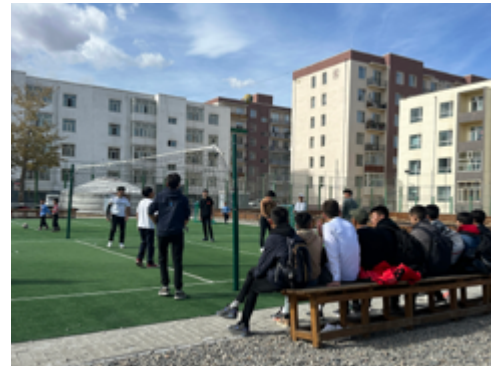
I aktivitetsparken kan du spille flere ballspill, eller du kan gå inn i en av gerene og spille sjakk eller noko anna.