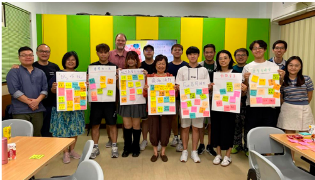
Engasjerte deltakere på workshop.

Han fikk se på dette som et talent som lar ham forstå og tjene mennesker med en lignende bakgrunn.