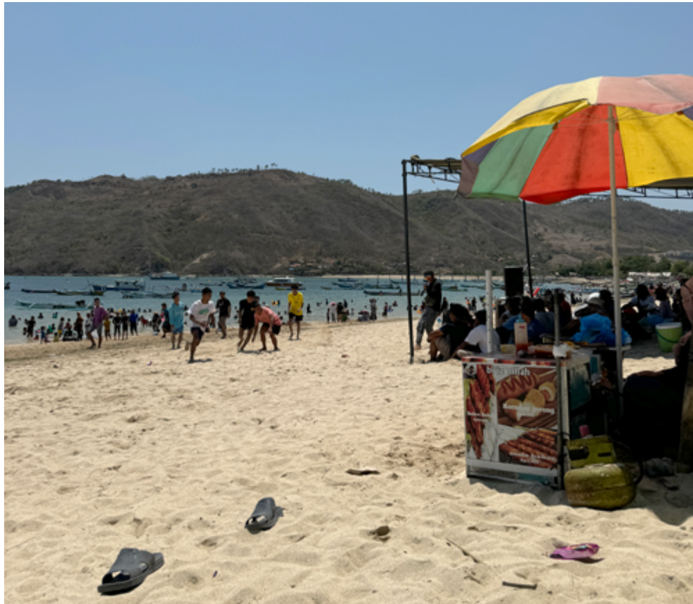
Det har blitt bedt mye for denne delen av øya.