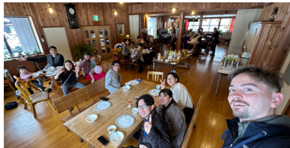
God stemning på vinterleiren i 2024!

I tillegg til undervisningen besøker musikkstudentene forskjellige institusjoner for å opptre med kristne sanger. Blant annet deltar de på en juletilstelning i et fengsel, og de besøker også for eksempel barnehager.