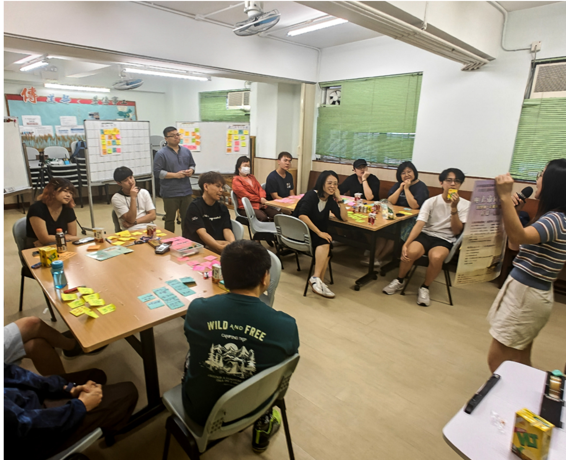
Engasjerte deltakere på workshop.

Sammen med våre samarbeidskirker ønsker vi å tilby ressurser til bibel- og lederopp-læring, både for menigheter og høyskoler. Gjennom «Use Your Talents» ønsker vi å oppmuntre de lokale menighetene til å bygge gode strukturer og programmer basert på de ressursene de har. Vi utvikler også ressurser til leseopplæring for voksne.