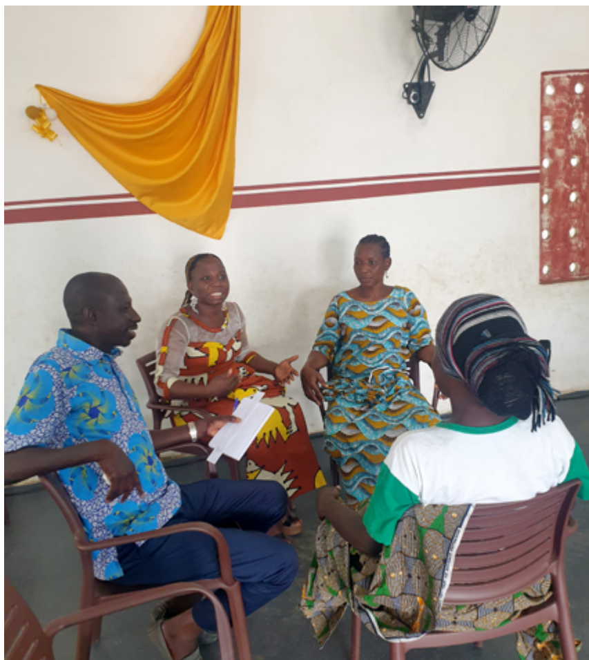
En gruppe omsorgspersoner samles i kirken i Abidjan.

– I tillegg har det vært mye fokus på at når vi foreldre gjør feil, må vi be barnet om unnskyldning.