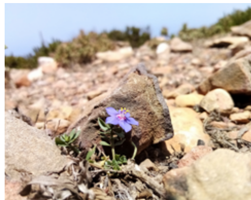
Evangeliet spirer i Nord-Afrika.