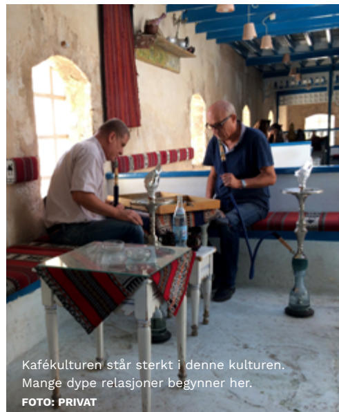
Kafékulturen står sterkt i denne kulturen. Mange dype relasjoner begynner her.