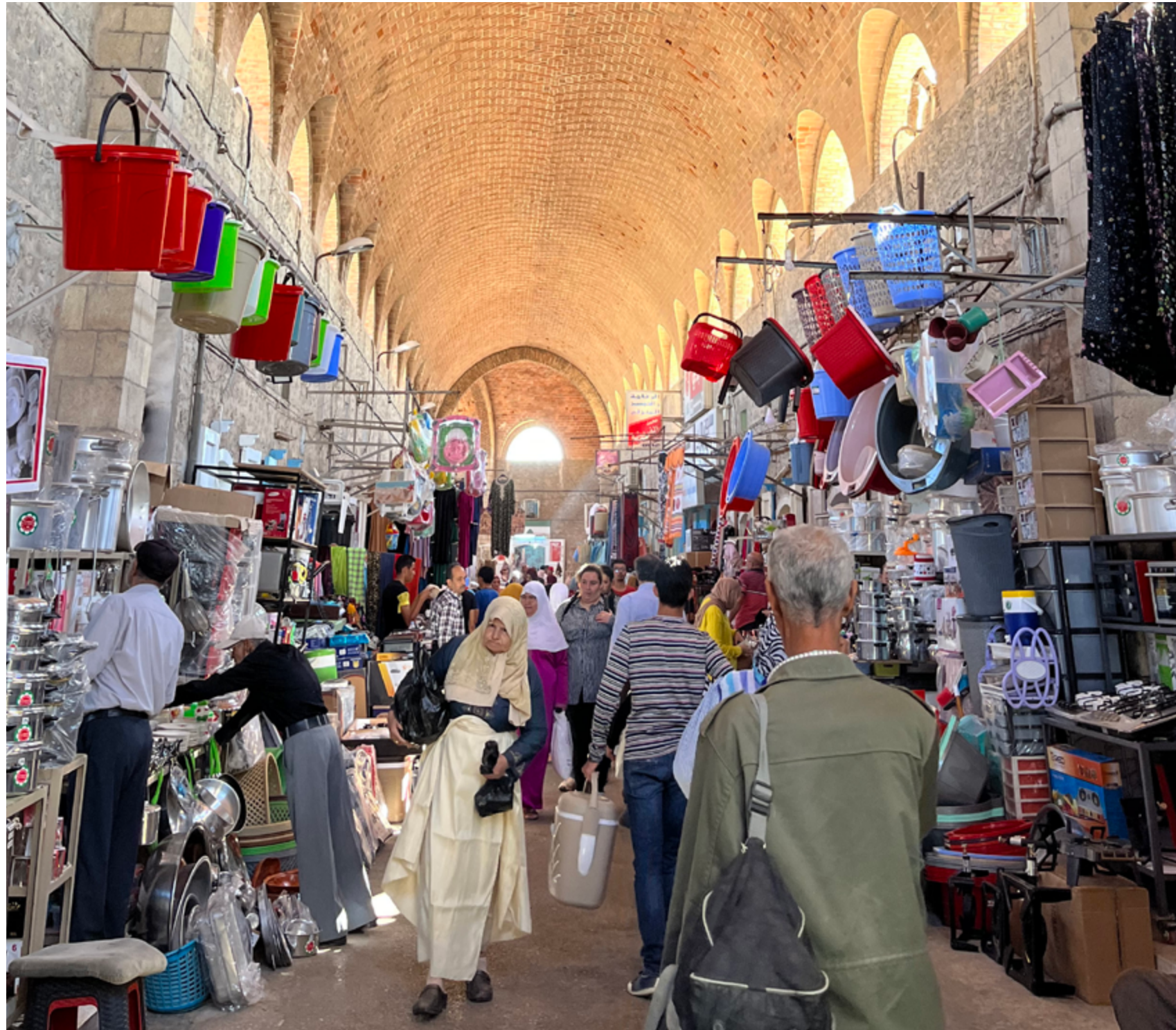
Vi er kalt til å lede mennesker til Jesus – og til å gå med dem videre på trosveien.

Det er under 0,1 % kristne i regionen. Det finnes flere huskirker. Noen hemmelige, andre registrerte. Noen fungerer godt, andre opplever store utfordringer. Det er få internasjonale arbeidere i landene, likevel arbeider Gud, og stadig flere får møte Jesus. Forkynnelse via media spiller en stor rolle.