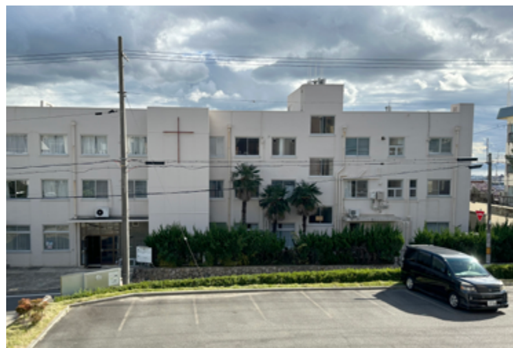
Kobe Lutherske Bibelinstitutt er fortsatt viktig for å utruste kristne i Japan til tjeneste i Guds rike.