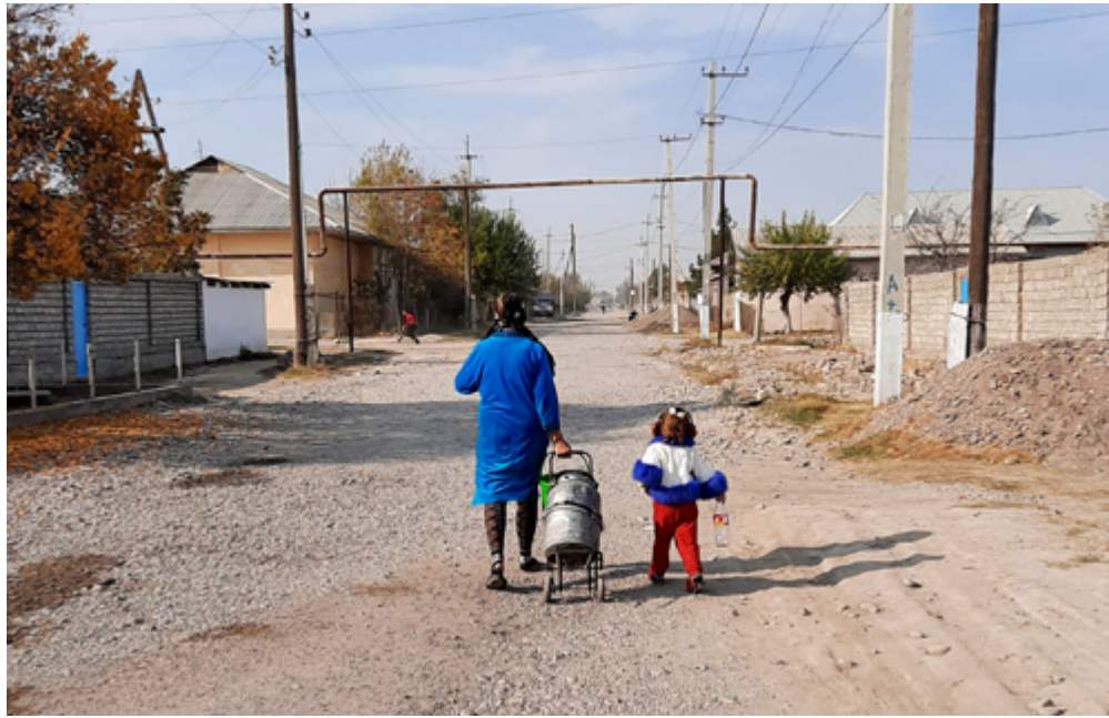
Det er mye fattigdom og arbeidsløshet i dette området.