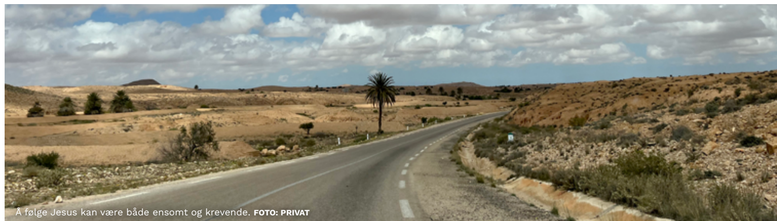
A følge Jesus kan være både ensomt og krevende.