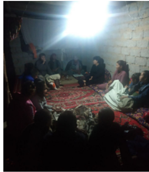
De få kristne i dette området må være forsiktede når de samles.