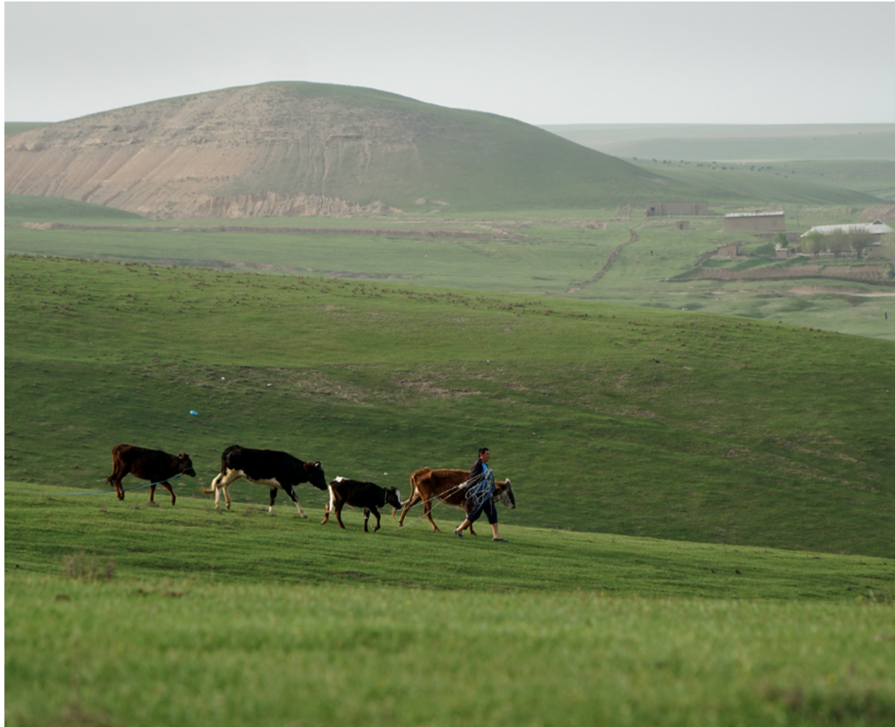
Mange menn flytter fra området på jakt etter arbeid.

Tross de utfordringer som kristne møter i Sentral-Asia, skjer det mye positivt. Mange er modige og deler sin tro med andre, og de lokale kristne viser et sterkt engasjement for misjonsarbeidet. Vi har mye å lære av dem og håper å kunne være en støtte for dem vi møter.