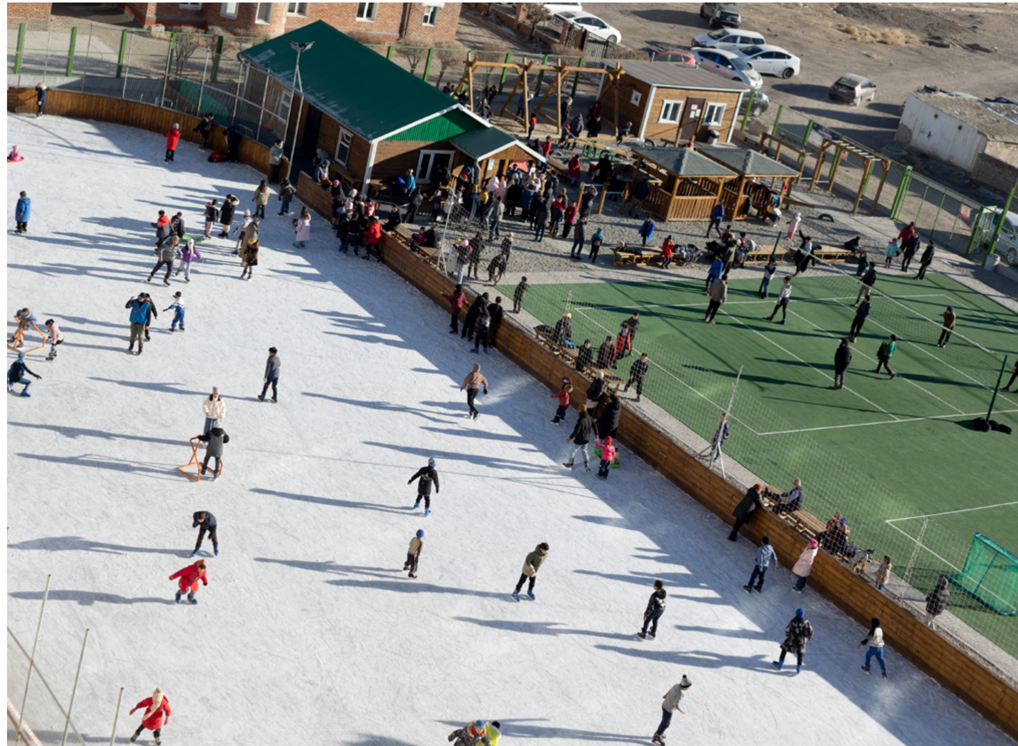
Det kryr av born og unge i aktivitetsparken.

Pr januar 2025 er vi 11 utsendinger og 7 barn i Mongolia. Fra august venter vi fem nye utsendinger, samt fem barn. Vi bor fordelt mellom Khovd og Ulgii, men starter et nybrottsarbeid i et nytt fylke i Vest-Mongolia i løpet av året. Her skal vi være med og bygge opp husmenighetene som finnes, samt starte opp et nytt prosjekt. Vi har nasjonale ansatte fordelt på alle våre tre andre avdelinger i Khovd, Ulgii og Ulaanbaatar.