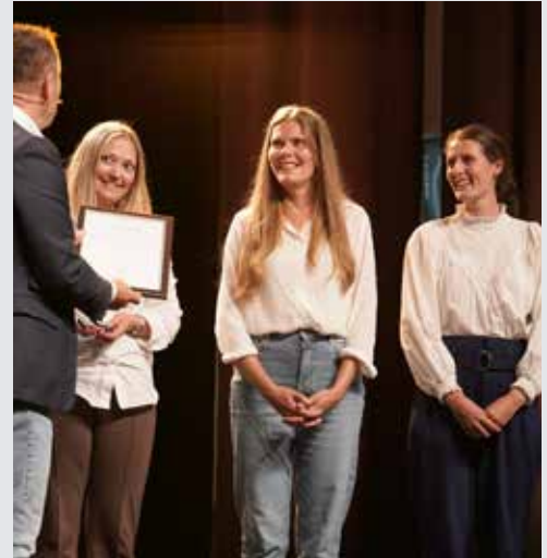
Representanter fra Tremorkirken mottar pris for sitt diakonale arbeid med «Velsigna Jul»

Vi er takknemlige om du vil ta med deg denne prosessen – fra strategi til handling – i dine bønner. Be om visdom til å prioritere det viktigste, blant alt som synes å være så viktig.