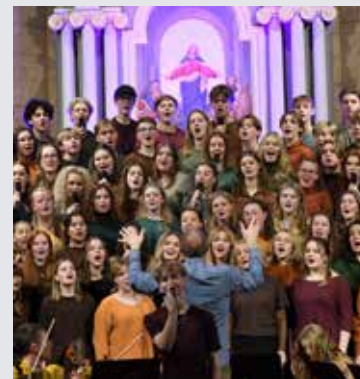
Fra en av Kongshaugs mange konserter.