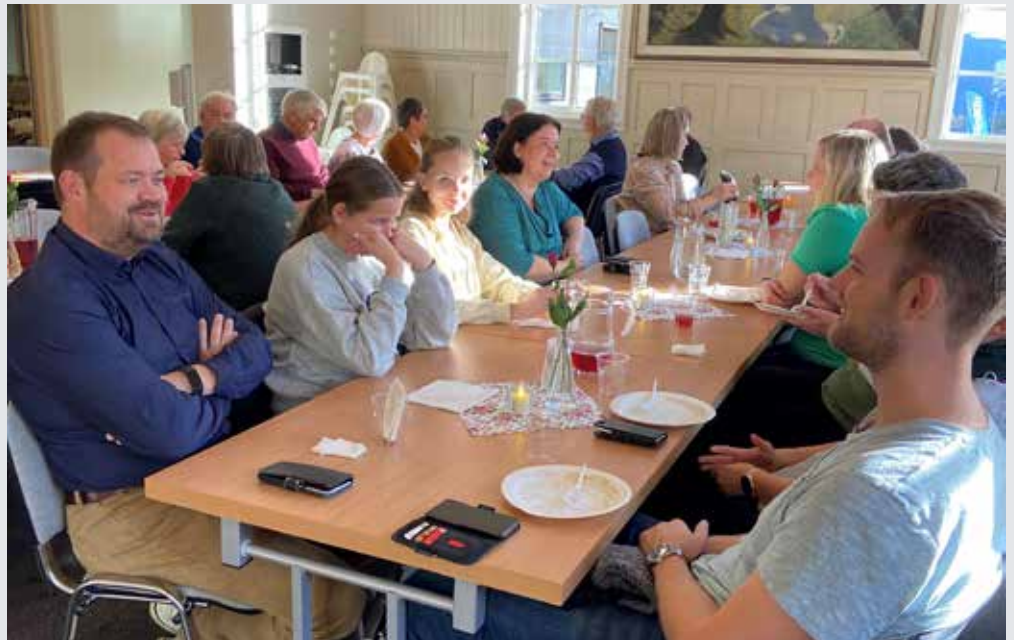
Bildetekst: God stemning på Inspirasjonssamling på Kleppe bedehus.

Skann QR-kode for å lesa heile strategien.