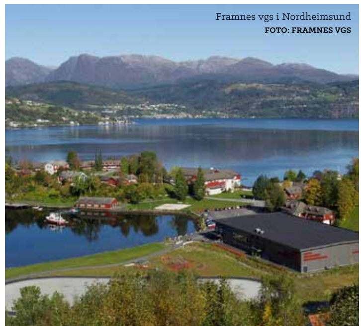
Framnes vgs i Nordheimsund

Parallelt med samlingar for vaksne, vert det også eigne samlingar for barn og ungdom. Følg med på nettsida og neste regionUtsyn for meir informasjon.