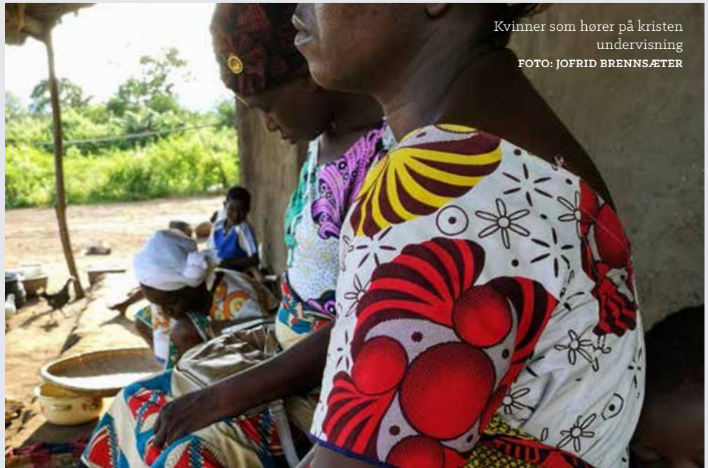
Kvinner som hører på kristen undervisning

Vær med i bønn! Be om at Misjonssambandet og den lokale kirken kan fortsette å være med på det Gud gjør i denne landsbyen. Be om