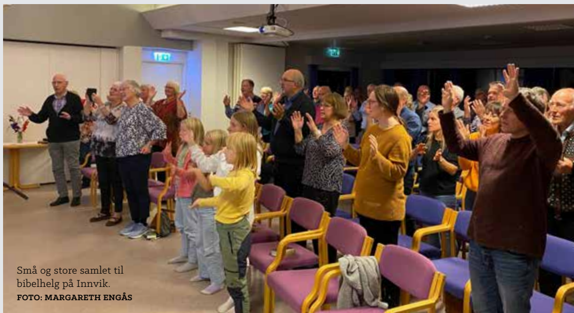
Små og store samlet til bibelhelg på Innvik.