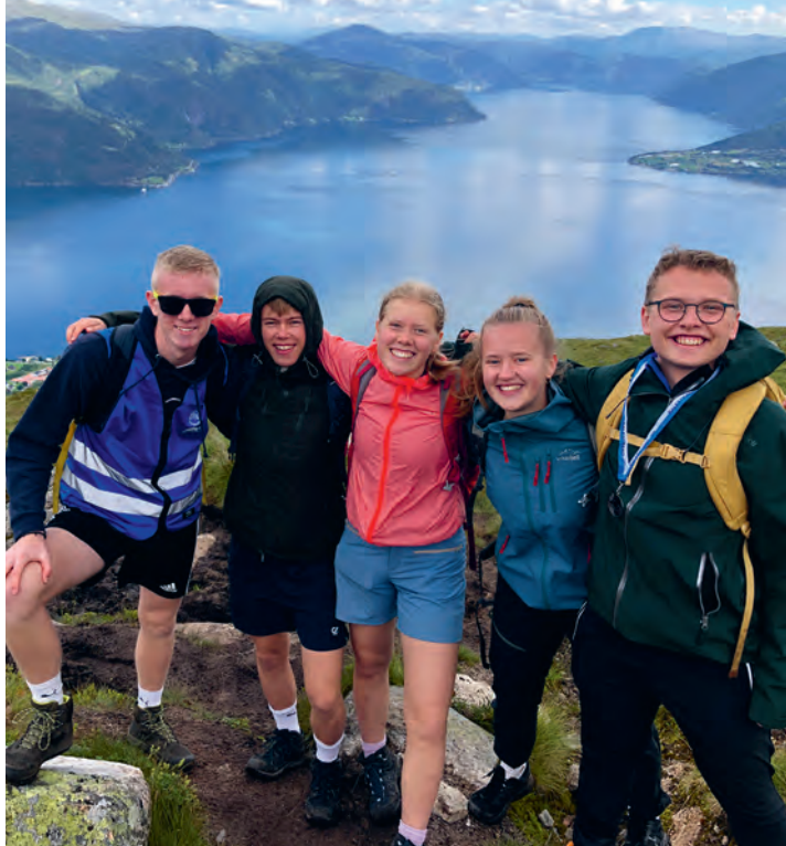
Sygna ønskjer å gi elevane sine gode utsikter