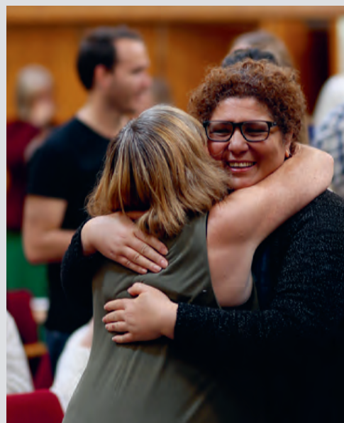
Bedehusfolket tok imot dei unge med opne armar.