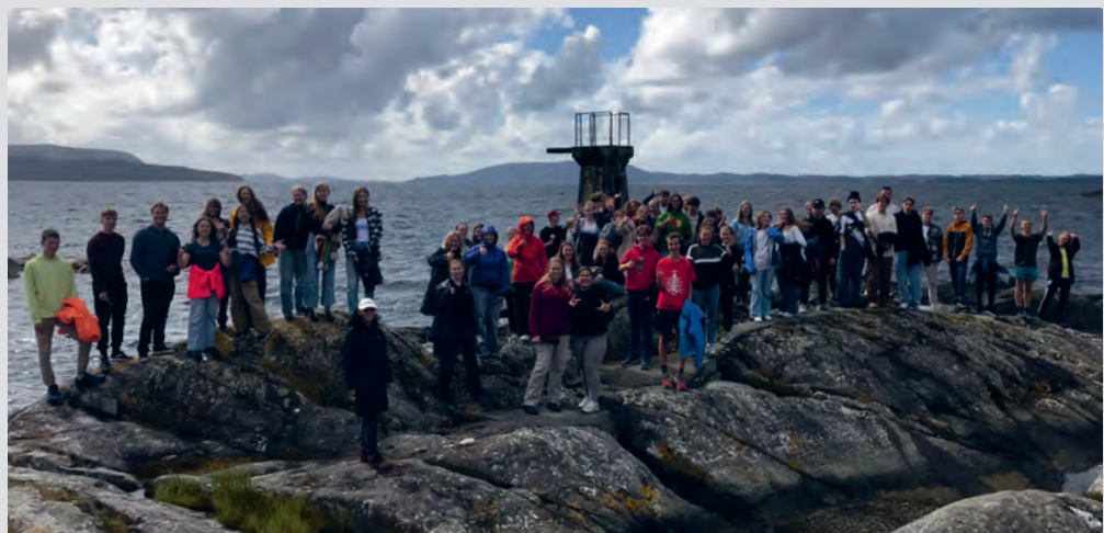
Bli kjent-tur til stupetårnet.

Klokken 13 var det infomøte for elever og foresatte i gymsalen. Her ble de bl.a. kjent med reglementet på skolen, hvilke klasser de skulle gå i og sine kontaktlærere. Senere var det åpningsfest for hele skolen. Der er det tradisjon at VG2 og VG3 står utenfor gymsalen og ønsker elever og foreldre varmt velkommen med stor applaus og hoi. Både de nye elevane og alle