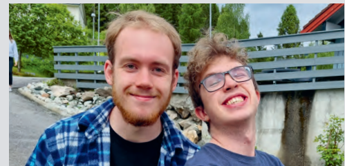
Glade SommerTreff-ledere.

STRENGARE, MEN OPE. Samtidig som området vert meir muslimsk og kontrollen og trykket frå styresmaktene vert sterkare, er folk opne og mottakelege. Mulighetene er der, fortel utsendingen. Ho meiner området beskriv godt bibelordet om at hausten er moden, men arbeidarane er få. Be gjerne om fleire arbeidarar, og at me finn ein god veg vidare, avsluttar ho.