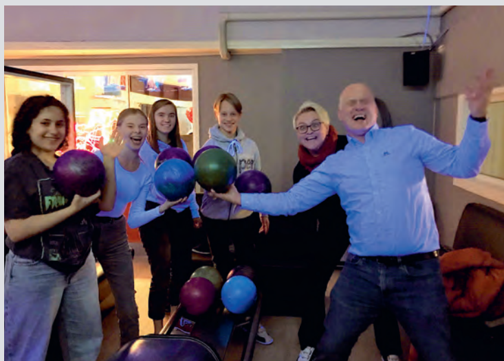
Sosiale aktivitetar skaper fellesskap og glede. Her frå Sunnfjord.