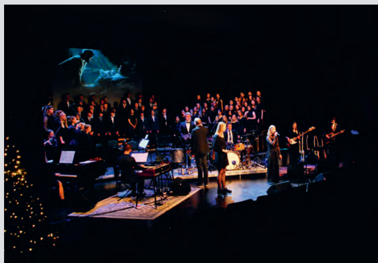
Glimt fra en av Kongshaugs mange julekonserter.

Nå følger noen spennende måneder for oss på skolene. Vær