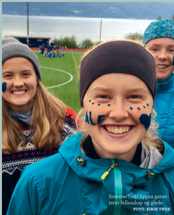
SommerTreff Sygna garanterer fellesskap og glede.