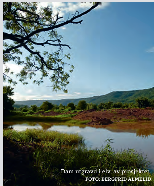
Dam utgravd i elv, av prosjektet.

«Frykt ikke, for jeg er med deg! Se deg ikke engstelig om, for jeg er din Gud! Jeg styrker deg og hjelper deg og holder deg oppe med min rettferds høyre hånd.» Jesaja 41,10