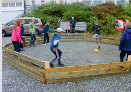
Barna var flinke til å tenke smittevern, også under utelek.

På Maksleiren hadde vi med oss flere ledere som var med som ledere for første gang. Det var kjekt