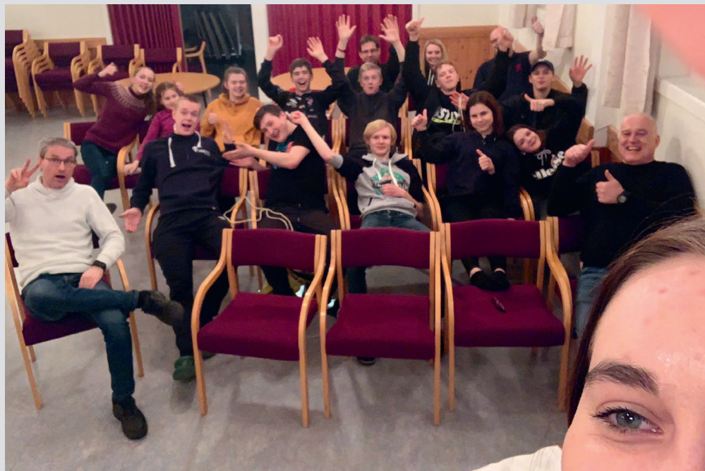
God stemning når ungdomane samlast.