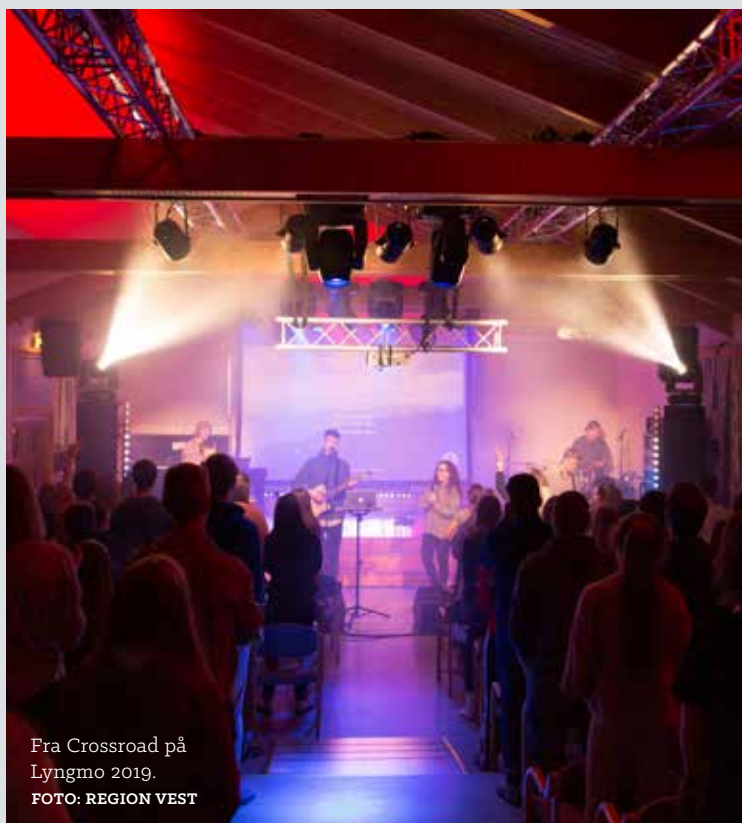
Fra Crossroad på Lyngmo 2019.