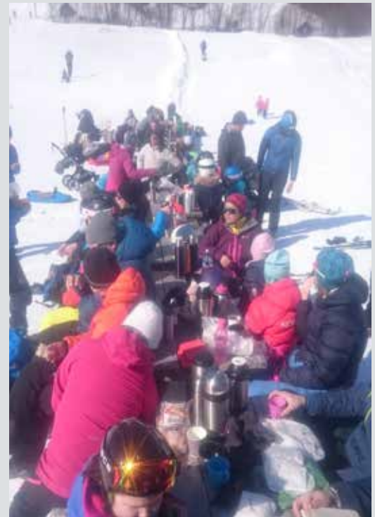
Godt med matpause på Sogn skisenter

Svara kan variera, men både bønn, personlege samtalar og inspirerende møtesamlingar er gjerne ein del av svaret. Kva brenn du for? Start gjerne der.