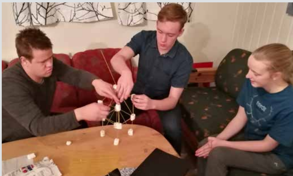
Viktig å lære samarbeid.