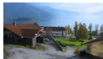
Sygna vidaregåande skule.