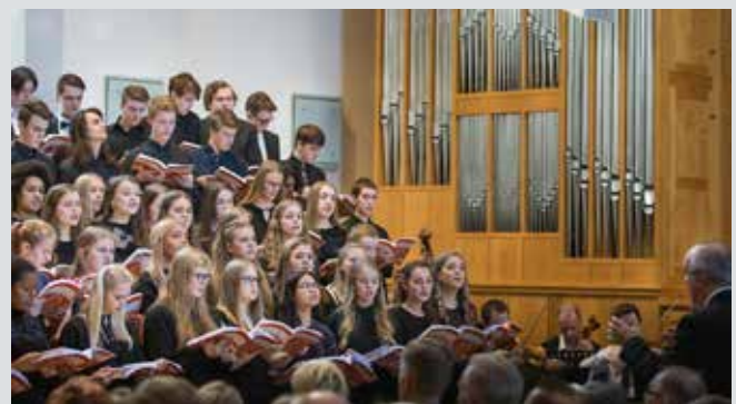
Kongshaug Musikkgymnas, forsterket med ansatte og tidligere elever, fremførte Händels Messia i inngangen til påsken.