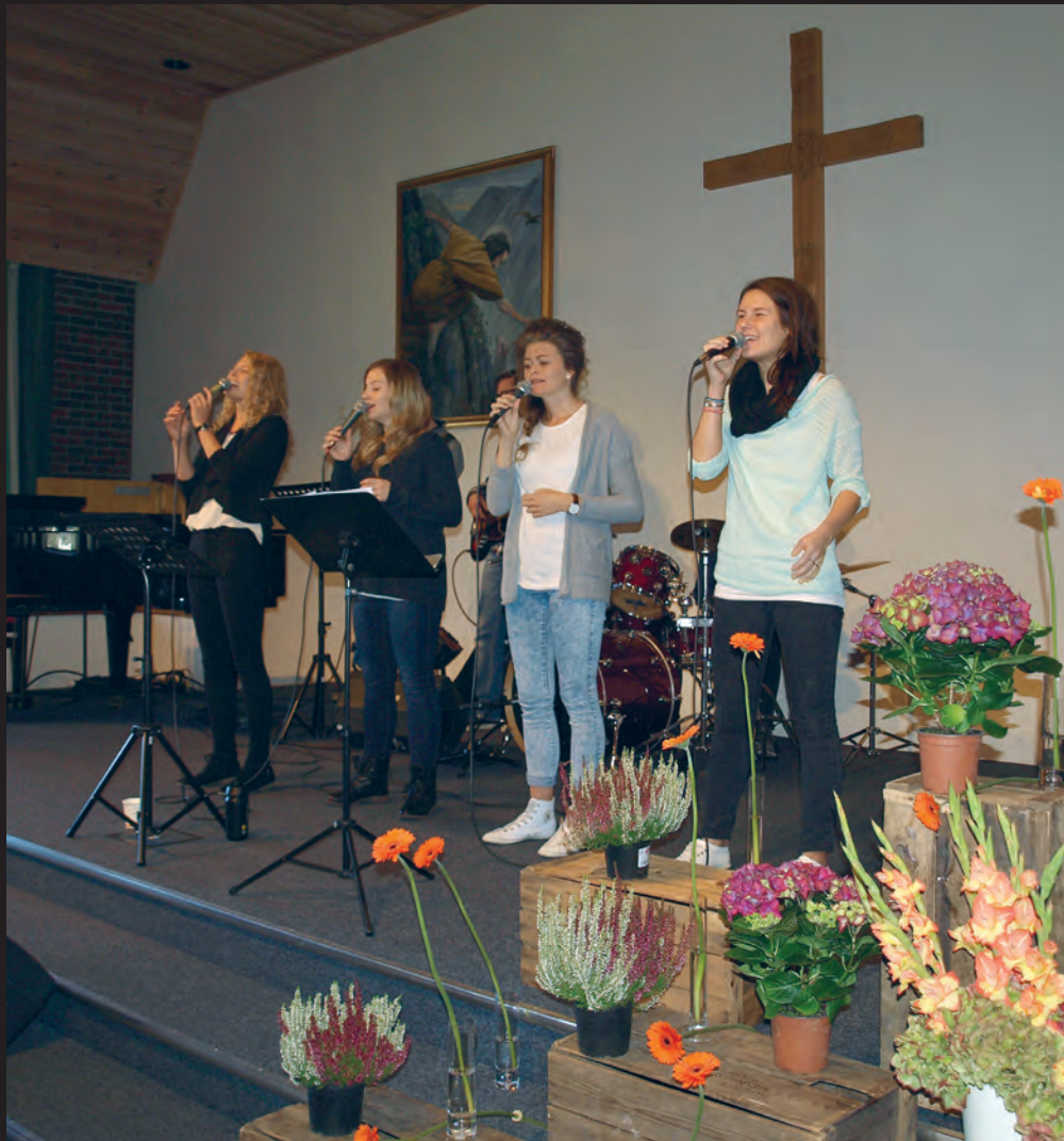
Barne- og ungdomsarbeidet i Misjonssambandet får nå støtte fra Sparebankstiftelsen SR-Bank.