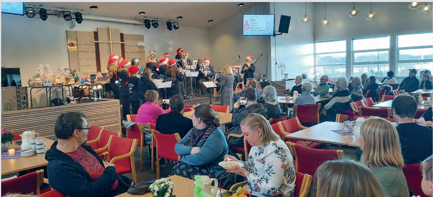
Leirvik bedehus på Stord, var et av stedene hvor det ble holdt julemesse sist høst.