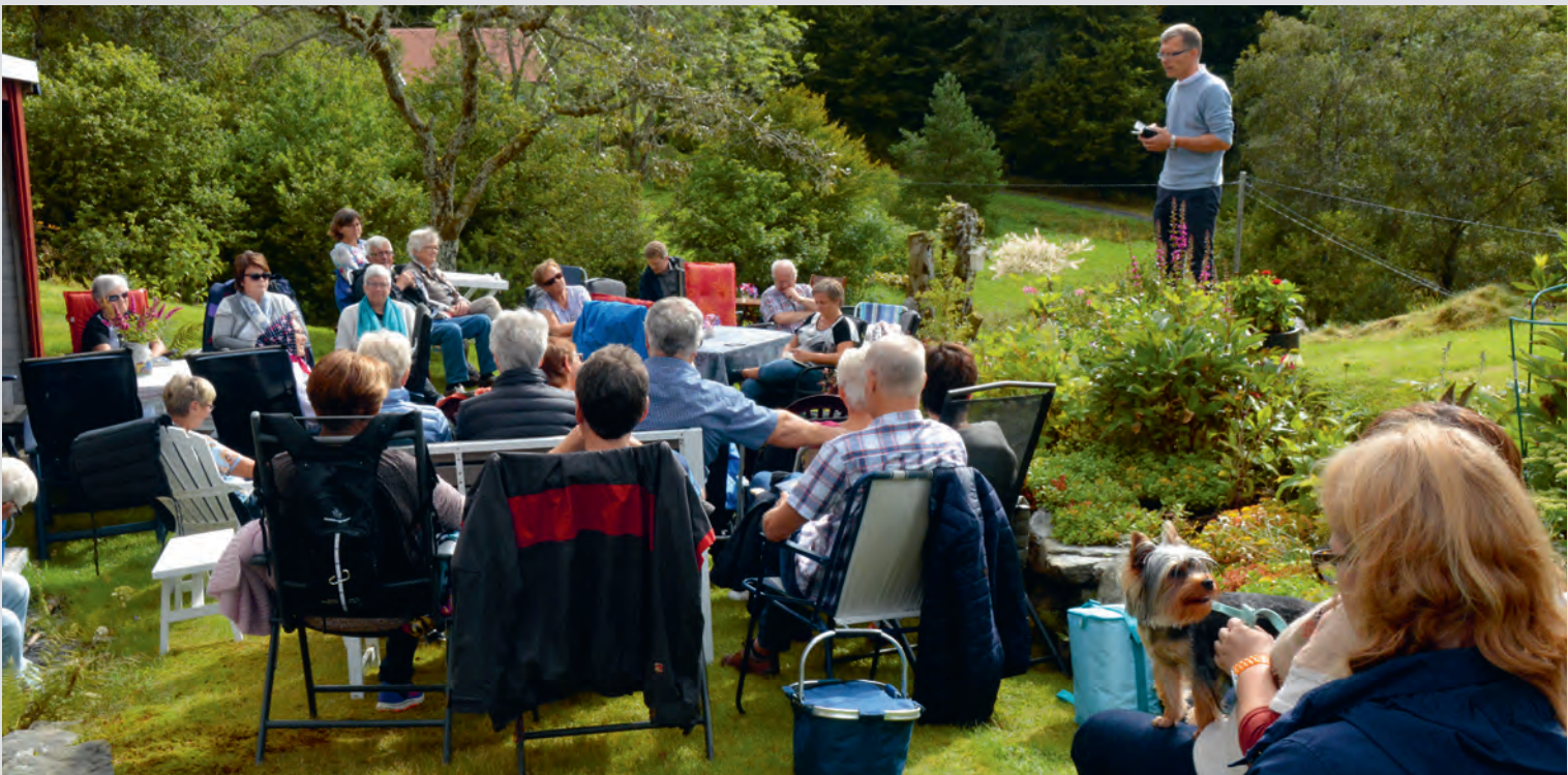
Illustrasjonsfoto fra sommermøtet for Misjonshuset i Haugesund på Kalland i august 2016.