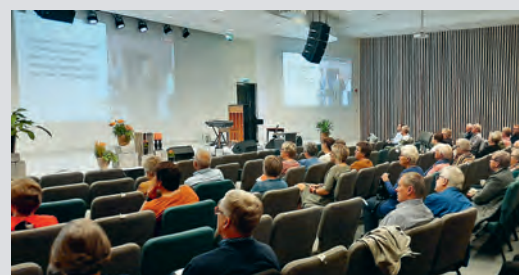
I likhet med i fjor vil årets regionårsmøte bli avviklet på flere steder med videoverføring mellom møtelokalene.

Vår sak i orden. Landet vårt er i «desperat behov for vekkelse», var det en som sa en gang. Tenk om Gud kunne få oss i tale slik at det blir om å gjøre for oss at vi har vår sak i orden med Gud.