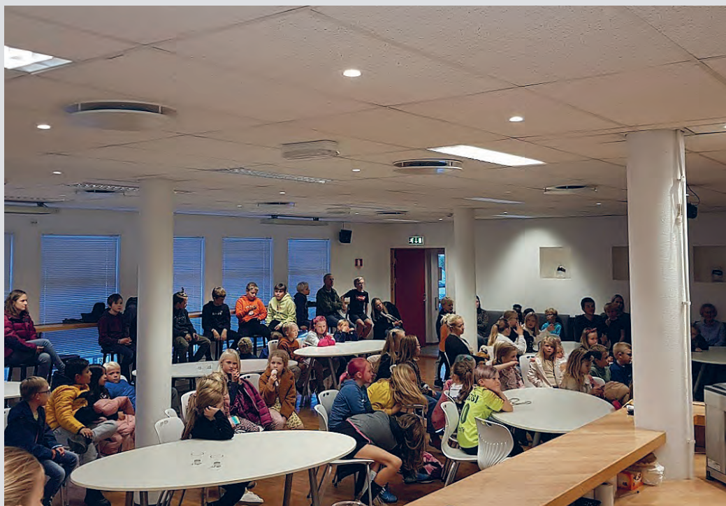
Supertorsdag på Jørpeland samler 60–70 unger i snitt.