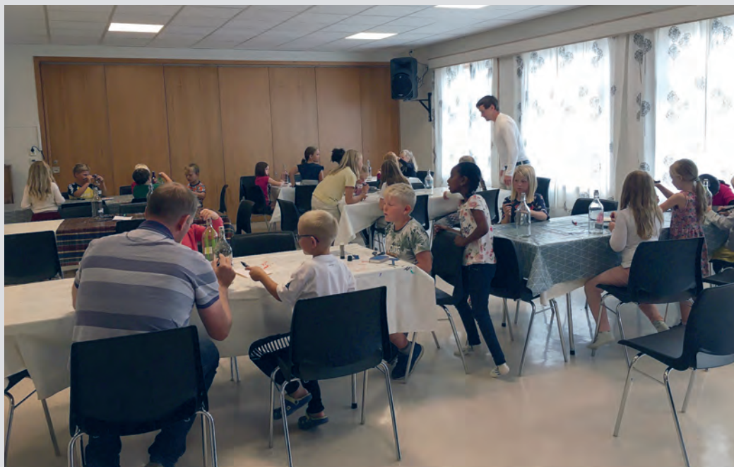
Partallstorsdager er det supertorsdag på Vikevåg bedehus på Rennesøy.