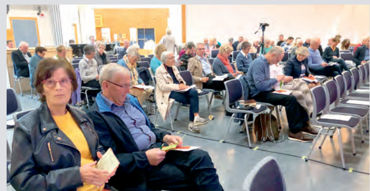
116 utsendinger var samlet på Trygheim vgs.