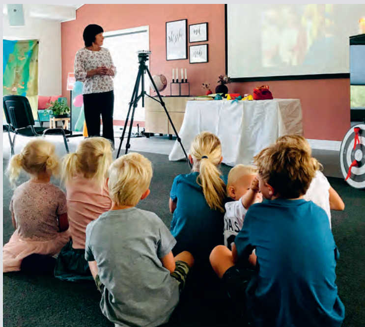
Et glimt fra «Sammen i sommer» leir på Tonstadli.

Salme 31,6 «I din hånd er mine tider», hva betyr det i ditt liv? var et av flere spørsmål som ble belyst i bibeltimene for de voksne. Misjon og tro i hjemmet var tema på kveldssamlingene. Ei flott uke hvor en var sammen på møter, måltider og aktiviteter.