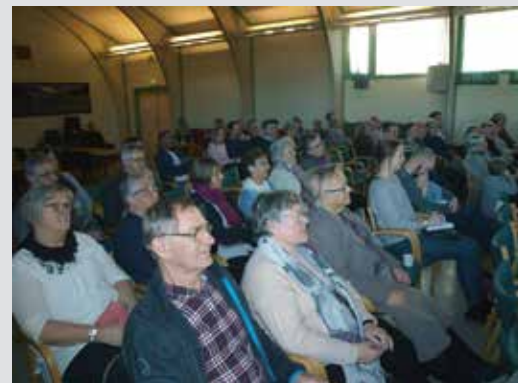
Fra forsamlingen lørdag under arbeidermøtet på Solgry.

Det å bli vekket fra søvn er ikke alltid behagelig. Men Jesus kommer snart, og vi må ikke bli igjen når han kommer. Ennå er det også mange som ikke har hørt budskapet om Jesus, og kallet vårt står fortsatt ved lag!!