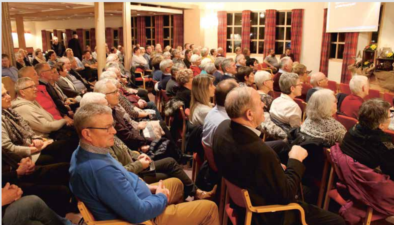
Fra forsamlingen fredag kveld i Riska misjonshus der årets nyttåsmøte ble holdt.