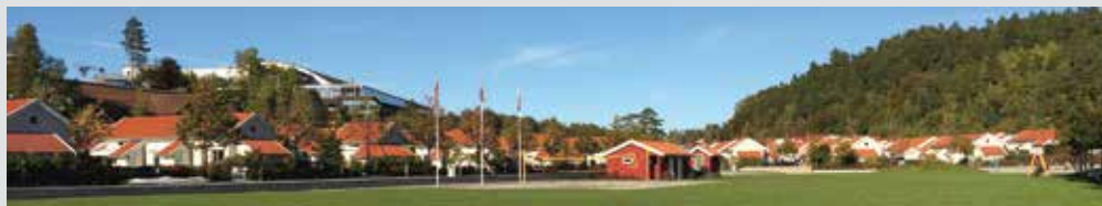
NLMs generalforsamling holdes på Oslofjord Convention Center i Vestfold første uken i juli.