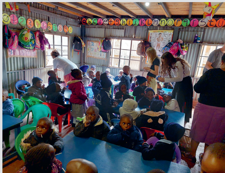
Fra besøk på en skole i Khawangareslummen med 70 elever i hvert klasserom.