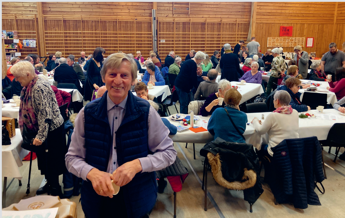
Godt besøkte julemesse- og basarer ble til mye velsignelse på slutten av 2022.

På Fauske ble det arrangert julebasar. Her kom det folk fra både indre og ytre strøk. Resultatet ble 56 000 til Jakobsbakken. En formidabel innsats blant de som trekker i trådene.