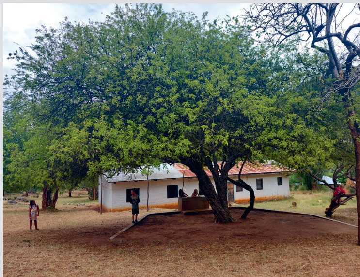
Under dette treet ble den første Gudstjenesten og første dåpen holdt i Pokot-provinsen.