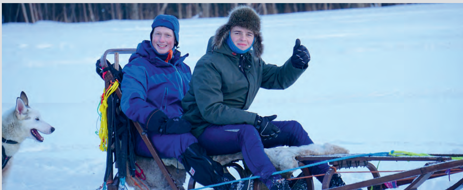
Hundekjøring var én av aktivitetene elevene fikk oppleve på Finnmarksturen.