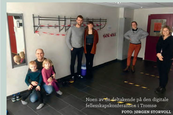
Noen av de deltagende på den digitale fellesskapskonferansen i Tromsø

Du er hjertelig velkommen til å delta en eller flere av disse dagene – meld deg på til fjellsenteret@jakobsbakken.no