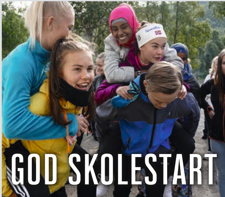
Det er vært en fin oppstart for regionens tre skoler. Bildet er fra Nordborg.