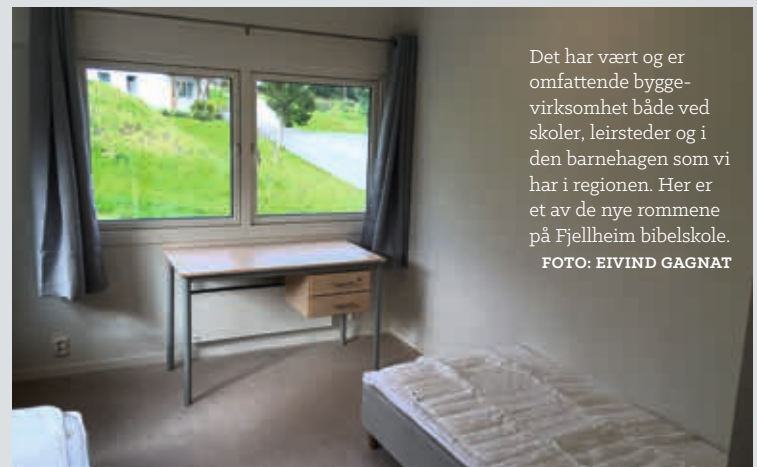
Det har vært og er omfattende byggevirksomhet både ved skoler, leirsteder og i den barnehagen som vi har i regionen. Her er et av de nye rommene på Fjellheim bibelskole.

NORDBORG VGS: Nordborg har planer om å bygge ut dette skoleåret. De skal bygge ut administrasjonsbyg-