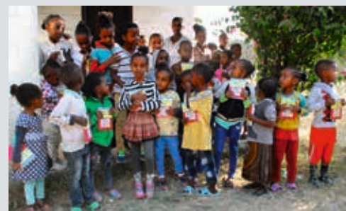
Søndag før jul ble det delt ut 48 barnebibler i Hogane søndagsskole i Hawassa. Søndagsskolen har fire klasser.