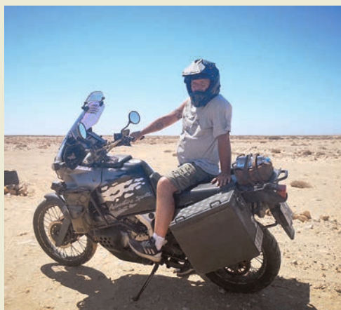
På motorsykkeltur til Mali.

Å gå fra misjonærtjeneste til regionleder be-