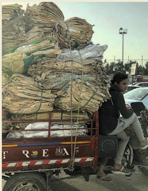
«Elisja» er eittåring i Nord-Afrika.