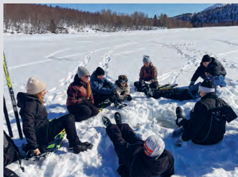
På en påskeleir ble det også anledning til å prøve fiskelykken på isen.

Jeg tror at en av de viktigste faktorene for å