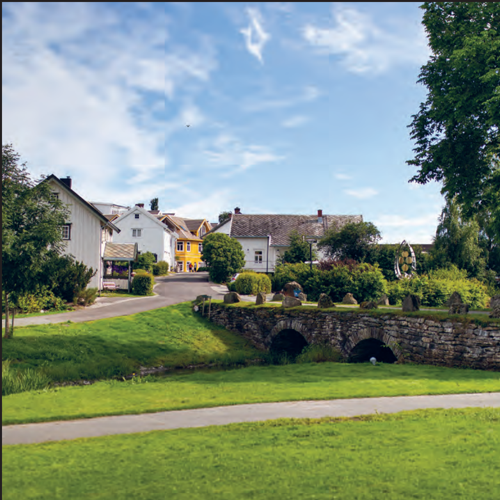
Inderøya blir samlingsstedet for årets regionkonferanse i Misjonssambandet, Midt-Norge. Her et bilde av Muusbrua i Straumen som ble bygd tidlig på 1800-tallet.