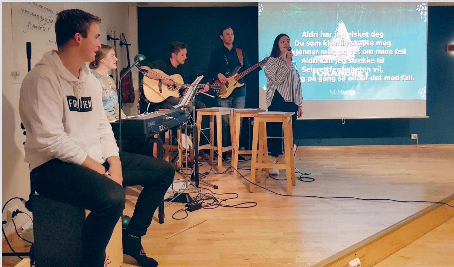
Vision-teamet besøker Val.