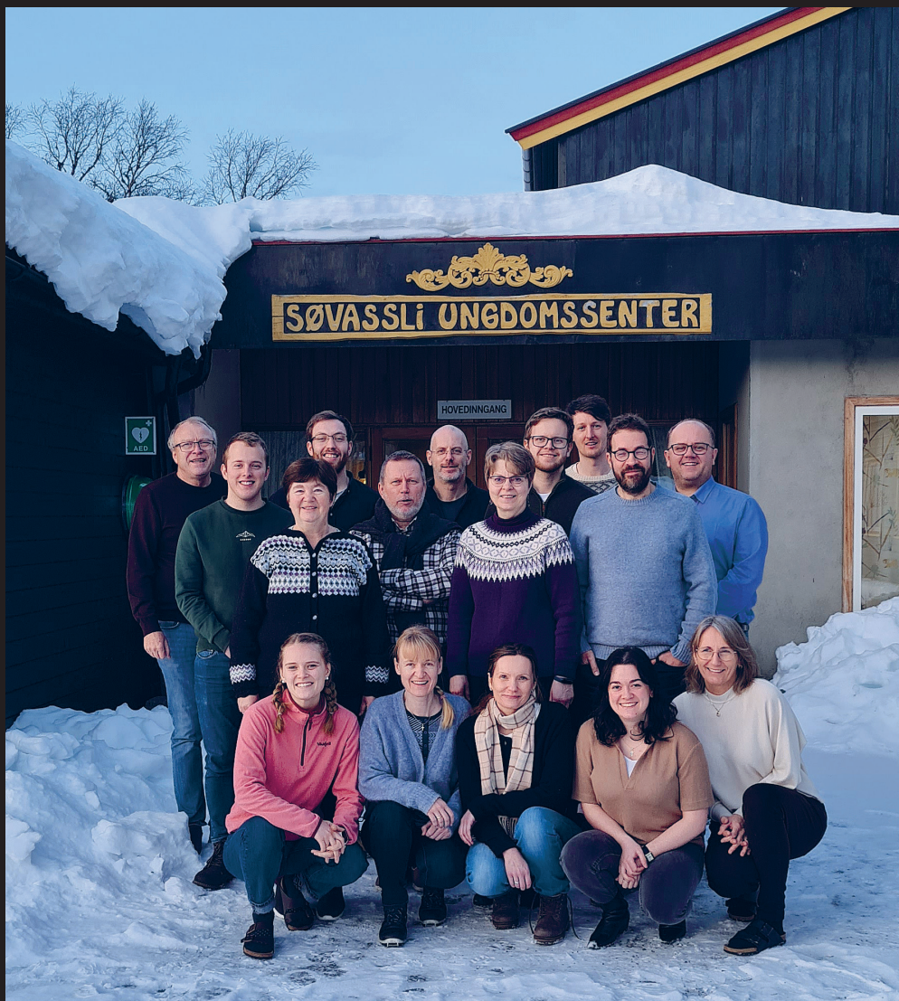
Ansatte i Misjonssambandet Midt-Norge samlet til medarbeidersamling på Søvassli ungdomssenter.