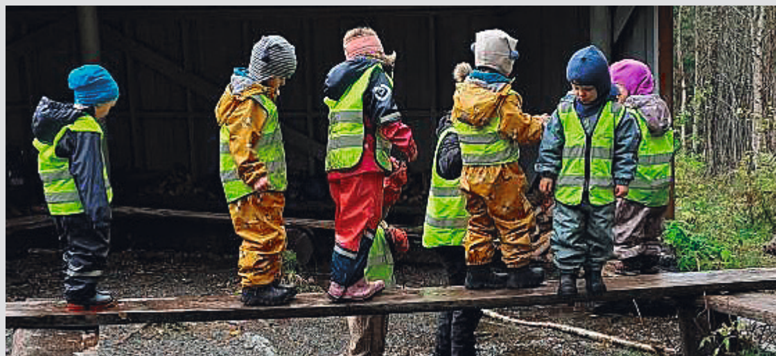
Noen av barna i Heggli barnehage leker ute i det fri.

– Vi har nettopp flyttet inn i et nytt hus etter 40 år i gamle Heggli barnehage, og da er det et fint tidspunkt å skulle få på plass