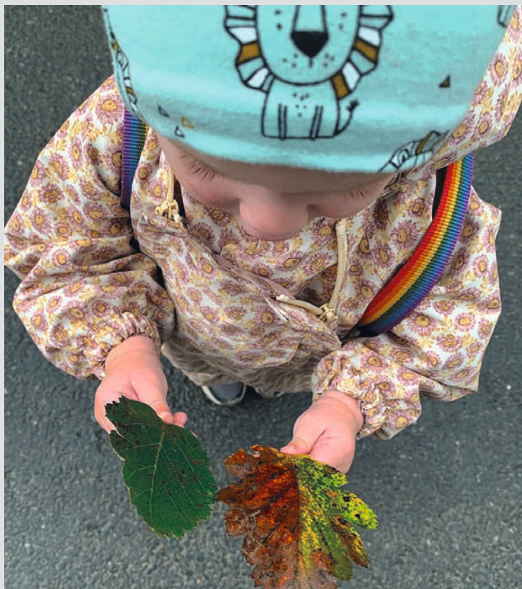
Høsten byr på mange farger i naturen. Her fra Spiren barnehage.

et nytt navn, selv om det selvsagt også er mange følelser knyttet til en navneendring, sier Stegali.