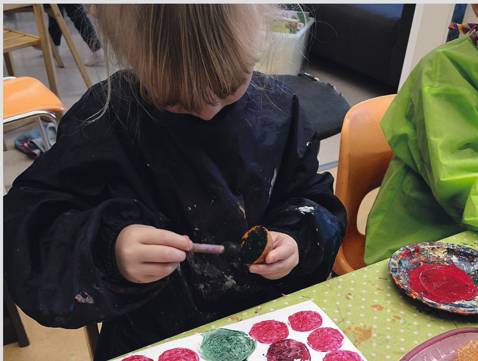
Misjonssambandet har ofte juleverkstad i november og desember.