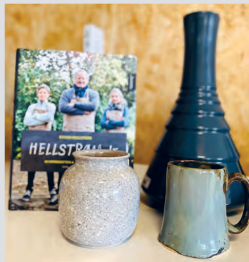
Keramikk og bøker er blant varene som selges i gjenbruksbutikken på Orkanger.

FRIVILLIGE. – Butikkene har god varetilgang. De får tilbud om alt fra store dødsbo til små poser med nips, og det kreves mye arbeid på