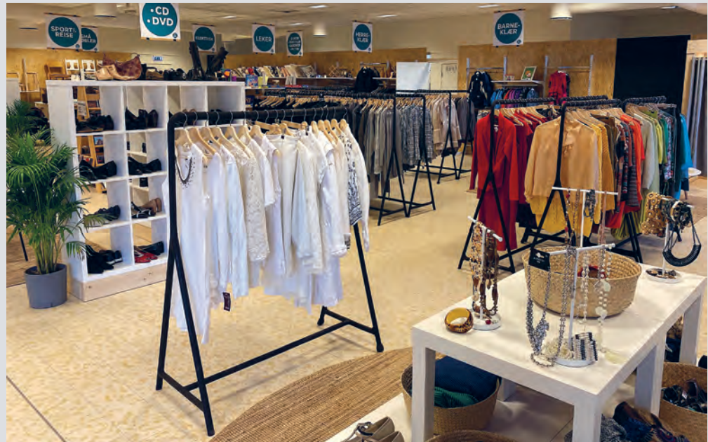
Klær er en stor del av vareutvalget i gjenbruksbutikken på Orkanger.

– Gjenbruksbutikkens kunder kommer i dag fra alle samfunnslag. Det er kunder som gjerne ser etter noe helt spesielt, som vil ha noe annet enn standardvarene. Særlig opplever vi tilvekst av unge kunder som er opptatt av både bærekraft og redesign, sier Stavran.