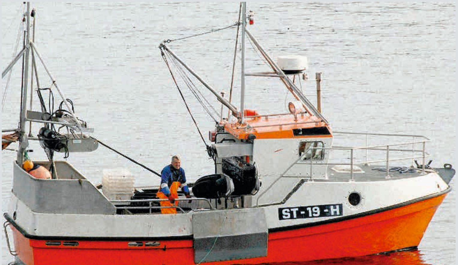
Leif Bakeng fra Hitra synes muligheten til å treffe folk og kunne snakke med dem om åndelige spørsmål, er en vesentlig side av det å være frivillig.