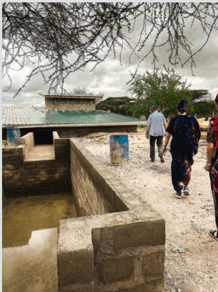
I Tana River graver nå de som bor der store cisterner som fylles med 500 000 liter vann de få gangene i året det regner, slik at de er sikret vann hele året.