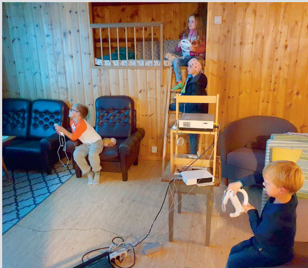
Barn på Fredagsklubben Vårblomst i Oppdal koser seg med dataspill på trygg avstand fra hverandre.